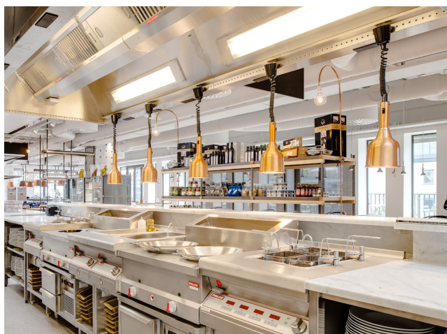
Köks- och serveringslinje Ahléns City

Med all kompetens under ett och samma tak kan vi leverera din drömlokal!