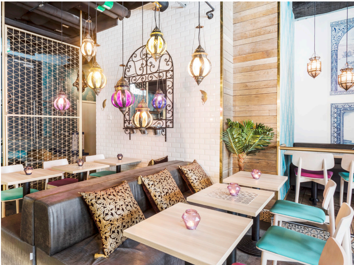
Liban Bistro Stockholm