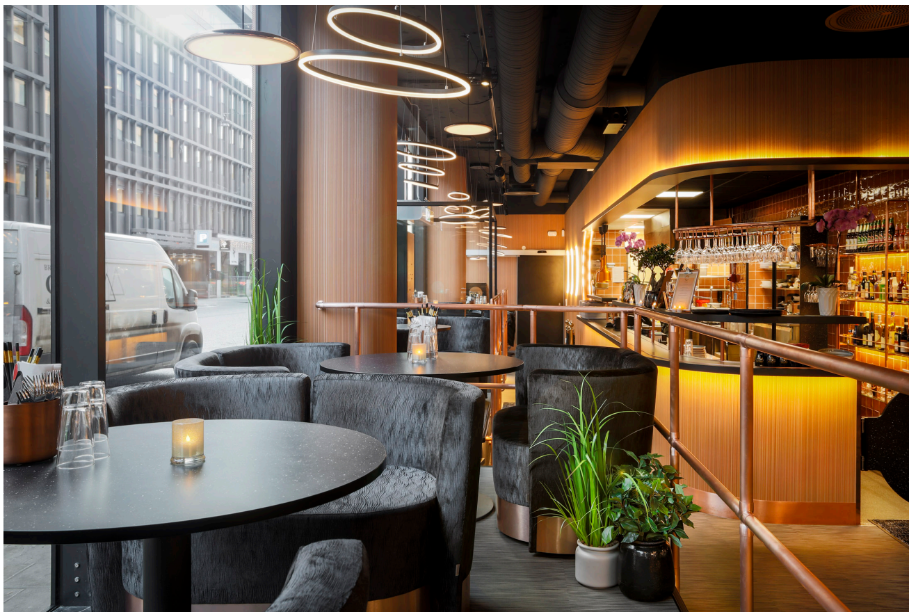
Fu-Do Asian Kitchen & Bar Gallerian, Stockholm