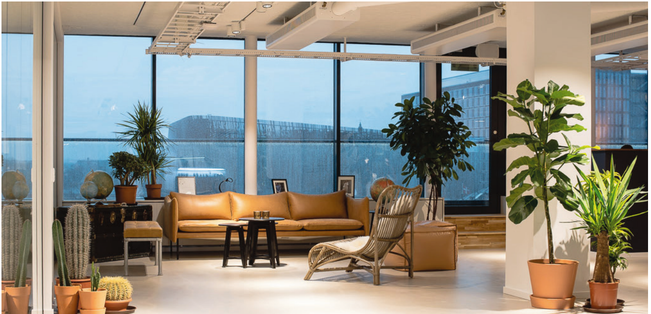
Daniel Wellington huvudkontor Vasagatan, Stockholm