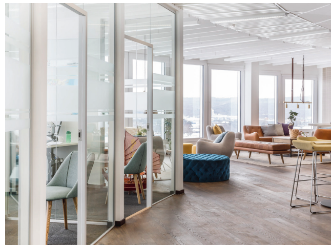
TKL logistik Jönköping