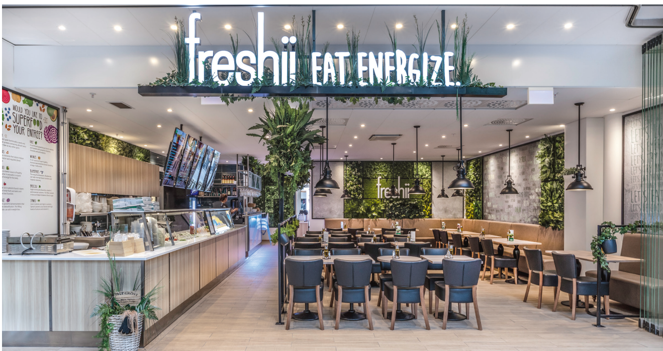
Freshii Globen, Stockholm