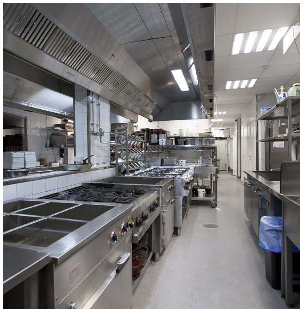
Indian Garden Västgötagatan, Stockholm