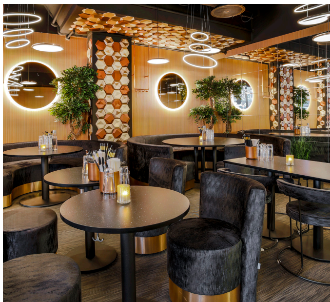
Fu-Do Asian Kitchen & Bar Gallerian, Stockholm