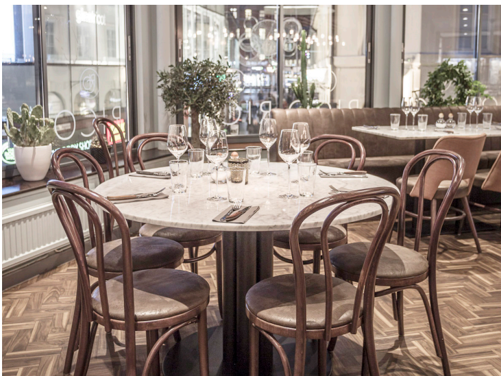
Ricos Tanneforsgatan, Linköping