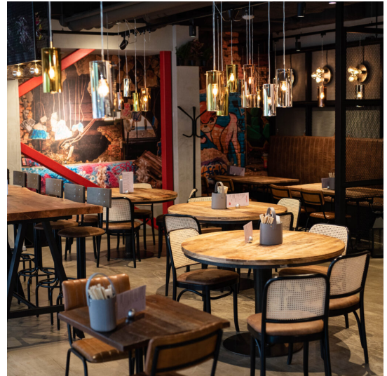
Re:bel Kitchen Vällingby, Stockholm