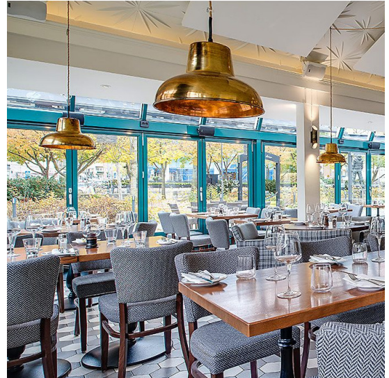
Le Parc Uppsala